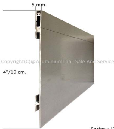
Series : LT100.12HL Product BY : ALuminiumThai